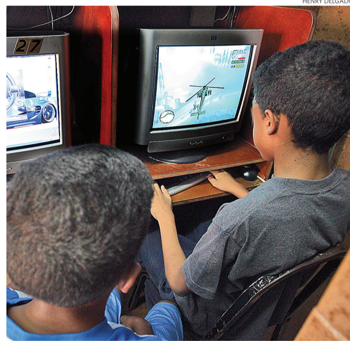
Pasar horas en el cibercafé es la ocupación de muchos niños desescolarizados

¿Que si se metía con los profesores? Claro. ¿Con los compañeros? No, casi no. ¿Citaron a su mamá? Sí, varias veces. Y ella le advirtió que si seguía portándose mal lo iban a botar. ¿Que el Gobierno dice que no se puede botar a ningún estudiante? Pues él afirma que lo expulsaron. ¿Que si hizo algo muy grave? Reconoce que sí. Vio, mal parado sobre un escritorio, un bombillo fluorecente de los largos y decidió lanzarlo en el patio central del liceo. No causó heridos, pero un directivo de la institución vio lo que hizo y eso provocó